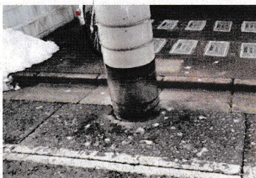
(ふんで汚れた道路)