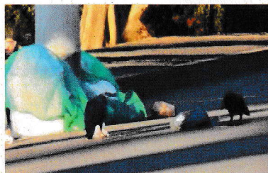
(ごみを漁るカラス)