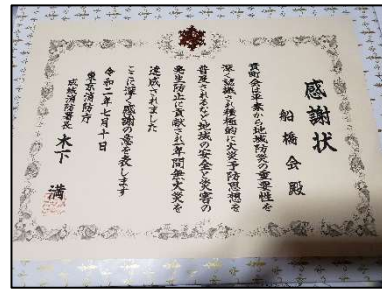
成城消防署より 感謝状