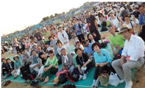
長岡にて集合写真

ちとふな商店街まつり参加。 光るおもちゃとかき氷を販売しました。 ～7/22 駅前広場にて～