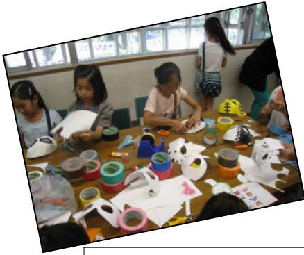
とっても上手にできました～ お面をかぶって、へーんしん！