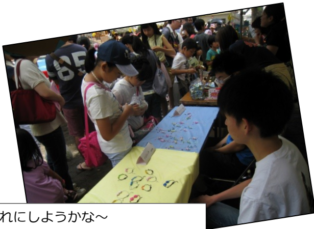
どれにしようかな～ 中高生による手作り小物屋さん