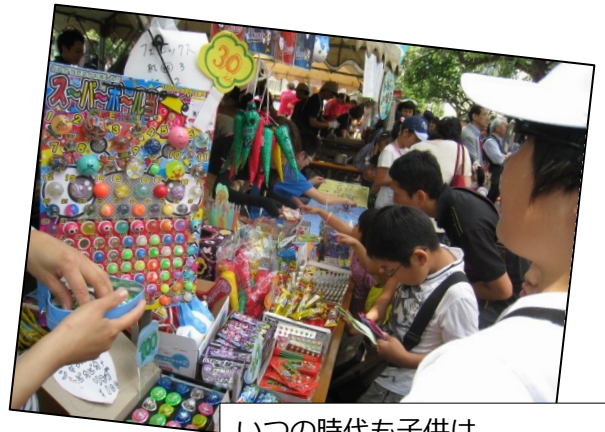
いつの時代も子供は 駄菓子にワクワク