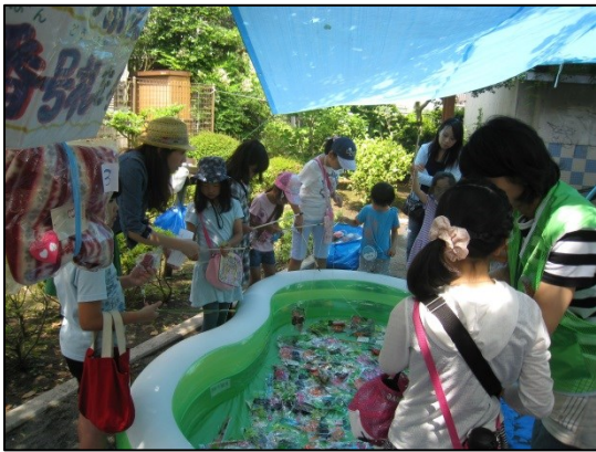
こちらは大人気コーナーの宝つり♪