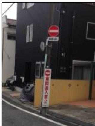
車両進入禁止の看板

「子供の広場」前の通りは一方通行ですが標識を見誤り、逆走する自動車が多くみられました。またその自動車が観音堂方面に曲がろうとするのを、目撃されたことがある方もいらっしゃるのではないのでしょうか。そこで初めて通る運転手の方でも気が付きやすいように看板による表示を申請し11月に設置となりました。