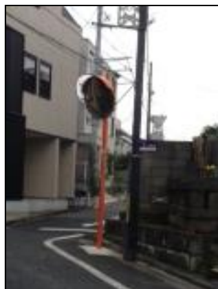
カーブミラーの増設

また10月には森繁通り沿い、マンション「setagaya teveye」前と「観音堂」脇の坂の途中の2箇所にカーブミラーが設置されました。