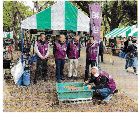
大人気のスーパーボールすくい

これからも粕谷会は、地域の皆様の声を反映して、『子供、高齢者、障害者』にやさしい町会として、役員一同がんばりたいと思います。