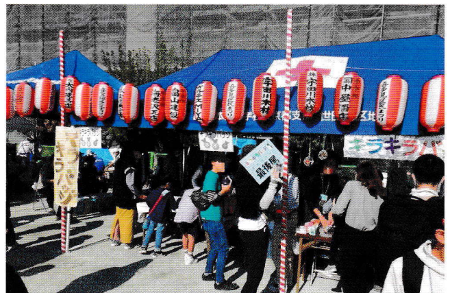
大人気の出店テント

喜多見地区区民まつりのルーツである砧第4地区区民まつりが開催されたのは、昭和55年（1980年）11月28日（日）でした。主催は、青少年地区委員会の前身である青少年対策地区委員会とのことです。