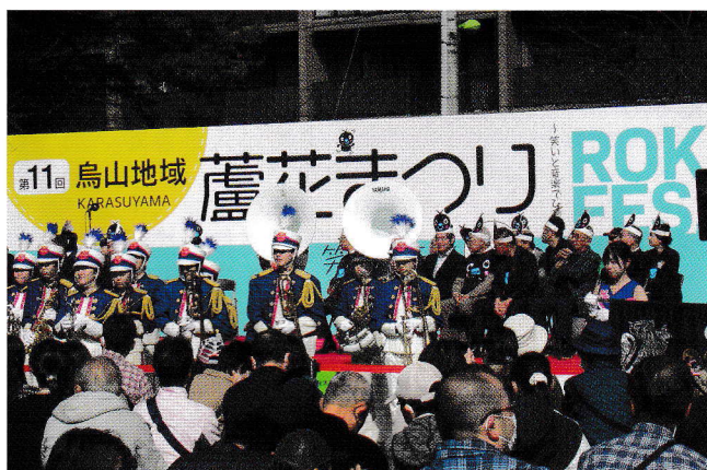
蘆花まつりの様子