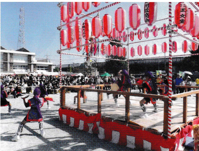
近隣の小学生によるエイサー

私は喜多見地区区民まつり実行委員長として来賓対応を含め、会場すべてに目を配るとともに、一町会長として、喜多見東部町会の出店テントの手伝いもしました。設営と後片付けを含めて朝早くから夕方まで夢中で働きましたが、久しぶりに充実した一日を過ごすことができました。一緒に働いてくれた皆さんには大変感謝申し上げます。